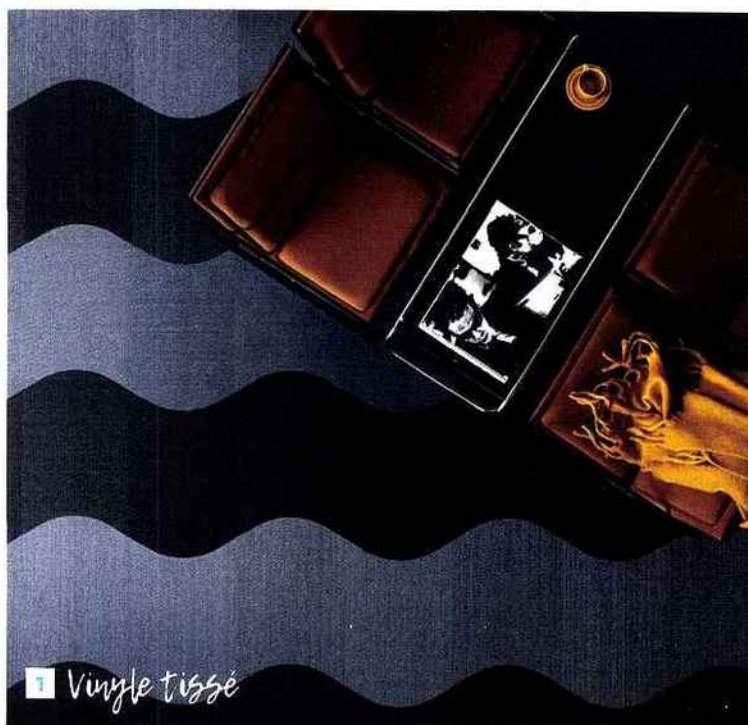
1 Vinyle tissé

Les carrelages, les moquettes, les stratifiés, les vinyles... Tous les sols se parent de motifs et de couleurs. Ils se montent et se voient, devenant ainsi des espaces décoratifs à part entière avec qui il faudra compter au moment de meubler et décorer votre intérieur.