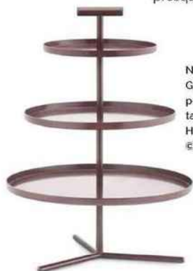
Normann Copenhagen, Glaze Tier Cake - Plat à service pour présenter les gâteaux, tartes...En aluminium poudré. H 26,5 cm - Ø 15,5 ou 24,5 cm.

Les teintes s'expriment par des vibrations profondes. Comme si la matière créait de nouvelles couleurs presque insaisissables.