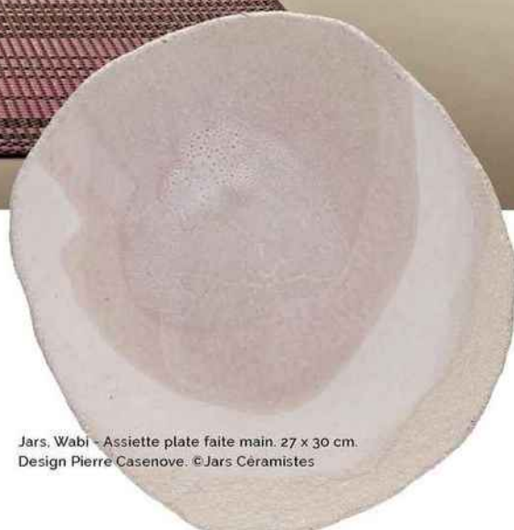
Jars, Wabi - Assiette plate faite main. 27 x 30 cm. Design Pierre Casenove. © Jars Céramistes