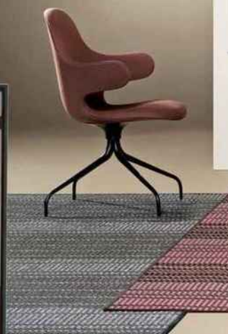
Bolon, Villa La Madonna Première collection de tapis aux motifs géométriques colorés, mélangeant fils de vinyle et de coton. 3 x 2 m. ©Bolon