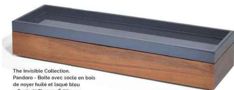
The Invisible Collection. Pandoro - Boîte avec socle en bois de noyer huilé et laqué bleu « Raphaël Thomas Éditions ». L 60 x P 18 x H 11 cm.