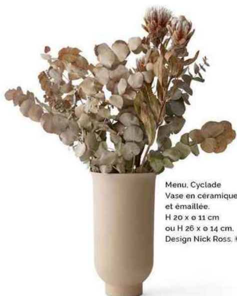
Menu, Cyclade Vase en céramique brute et émaillée. H 20 x ø 11 cm ou H 26 x ø 14 cm. Design Nick Ross.