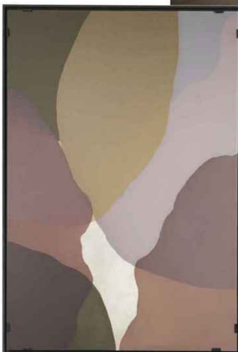
Tai Ping, Cinematic Wind II Tapis de la collection Scenematic. Noué main, Mohair, soie, cachemire et laine, 6 dimensions. Design André Fu.