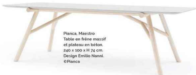
Pianca, Maestro Table en frêne massif et plateau en béton. 240 x 100 x H 74 cm. Design Emilio Nanni. ©Pianca