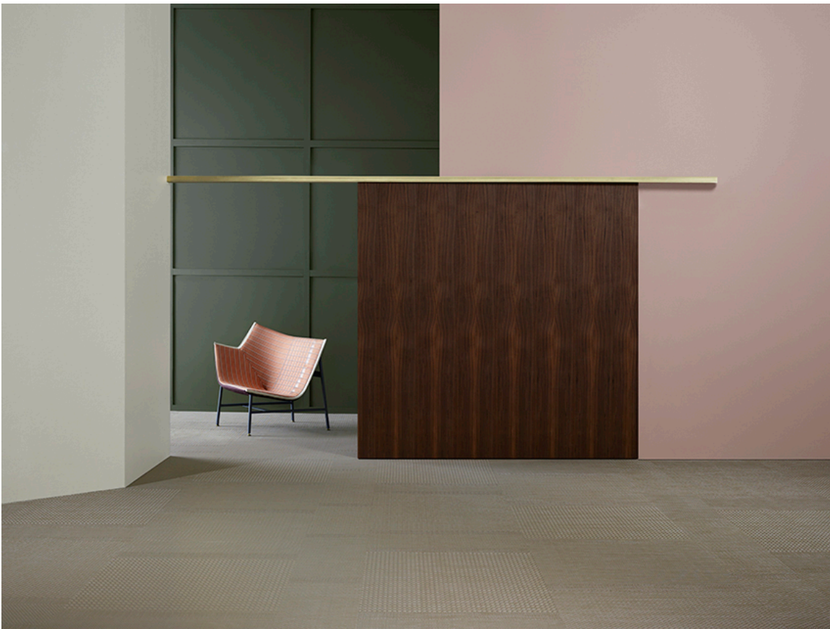
BOLON BY YOU – Weave Beige Sand Gloss